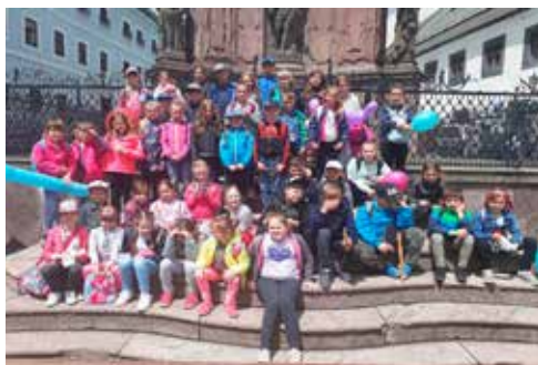
Opekačka v Trstenci