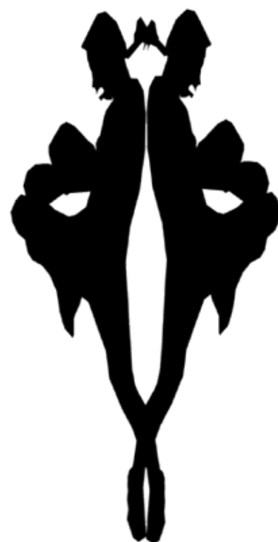
Foto: archív Ema Brázdová a Lukrécia Lachká Autor: Marko Mikulášik