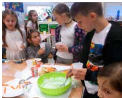
Výlet - Banská Štiavnica