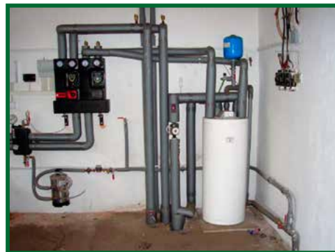
Rekonštrukcia kotolne MŠ

V škôlke došlo počas letných mesiacov ku kompletnej rekonštrukcii sociálnych zariadení na oboch podlažiach. Nové kúpeľničky pre škôlkarov sú príjemným a hygienickým prostredím, plným svetlých odtieňov a funkčného vybavenia. Aj v tomto prípade