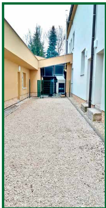
Rekonštrukcia budovy a priestranstva za KD

Najväčšou investíciou roku 2017 je projekt zníženia energetickej náročnosti objektov obecného úradu a kultúrneho domu v obci. Cieľom projektu sú úpravy, ktoré znížia objem energií potrebný na kúrenie, chladenie či svietenie v objekte, pričom výsledkom majú byť nižšie účty za energie a tak vznikne viac možností pre obec investovať do ďalšieho rozvoja.