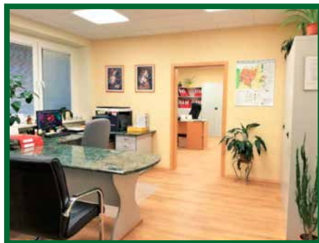
Zrekonštruované kancelárie OuÚ