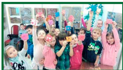
Exkurzia – Hornonitrianske múzeum