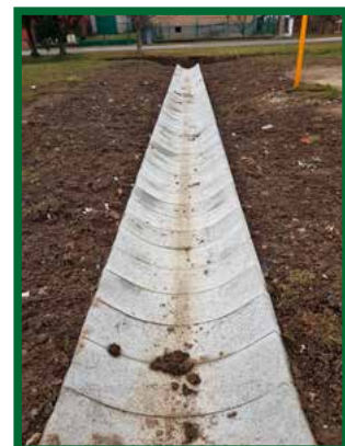
Odvodňovací žľab na ihrisku vo Vrbanoch