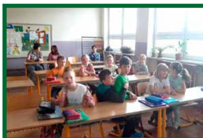
Deň otvorených dverí