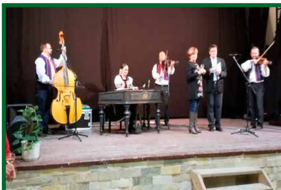
Úcta k starším