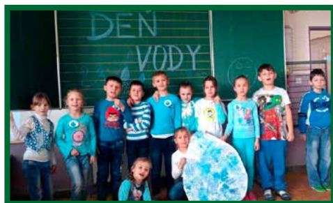
Svetový deň vody