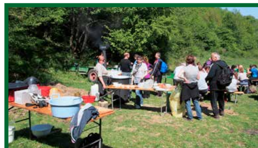
Turistický výstup na Rokoš s pohostením v „Dolinke“