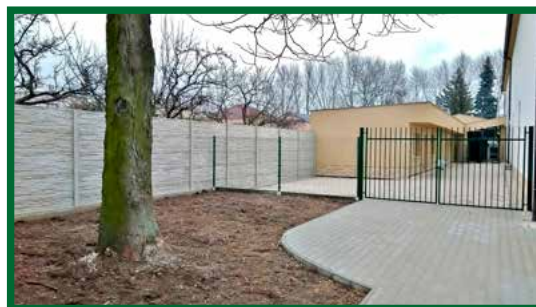
Nádvorie zberného dvora

V článku uvádzame len časť vykonaných prác a zrealizovaných projektov. Z tých drobných, no nemenej náročných, môžeme spomenúť opravu miestneho rozhlasu v časti obce, vybudovanie spevnenej plochy na nádoby pre separovaný zber pri pekárni, či doplnenie odvodňovacieho žľabu pri ihrisku v časti Vrbanoch.