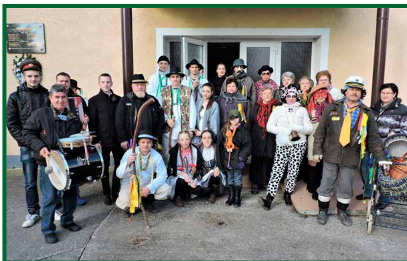
Fašiangovníci r. 2017