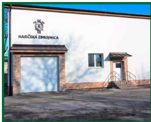
Nádvorie pred hasičskou zbrojnicou