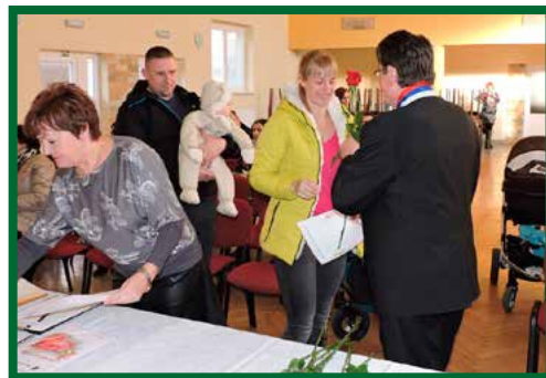
Uvítanie detí do života

Kalendária akcií, ktoré spoločne schvaľujeme a zosúladíme s obecným rozpočtom. V roku 2017 boli tieto akcie prvýkrát uverejnené v kalendári, ktorý dostala každá domácnosť od obce Diviacka Nová Ves. Obec je široká komunita, a preto je ťažké zaujať aspoň čiastočne našou ponukou všetkých. Tak posúďte sami, či sa nám niečo minulý rok podarilo!