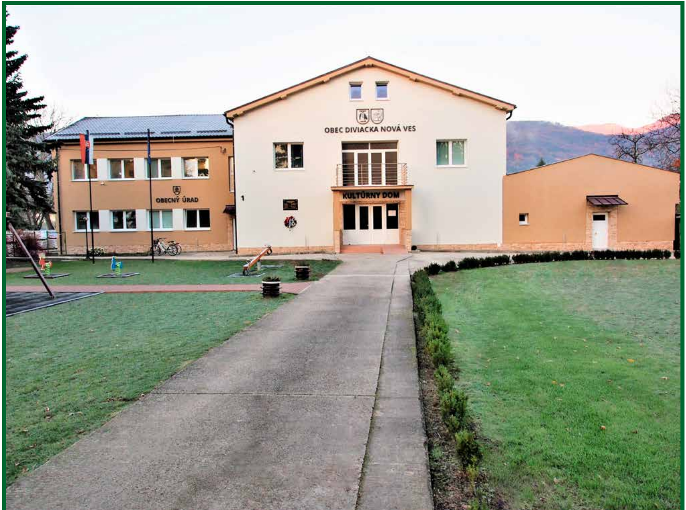
Zrekonštruovaný kultúrny dom

• ročník 6 • občasník • číslo 1 • február 2018