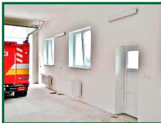
Garáž pre hasičské autá

V rámci projektu sa podarilo vyriešiť roky pretrvávajúci problém s atmosferickými zrážkami stekajúcimi zo strešnej krytiny k základom objektu. Zrážkové vody budú po novom dotovať rast zelene na okolitých plochách.