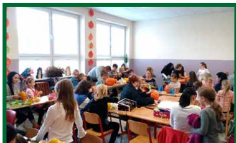
Svetový deň vody