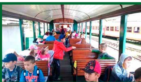
Výlet - Čierny Balog