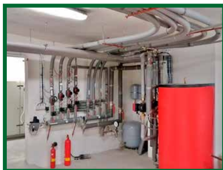
Rekonštrukcia kotolne KD a OuÚ