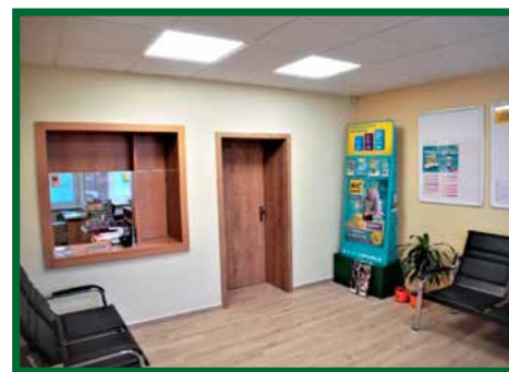
Zrekonštruované priestory pošty