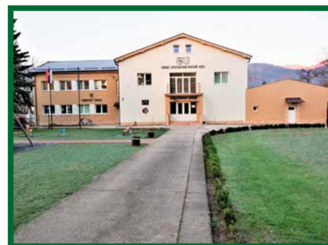
Zateplenie KD a obecného úradu