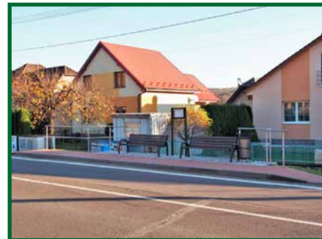
Chodník s nástupišťom na hornej autobusovej zastávke

Chodník bol pripojený na už vybudovaný úsek s priechodom pre chodcov. V mieste zastávky vznikla rozšírená plocha, kde našli svoje miesto lavičky, cestovný poriadok a nádoba na zber odpadu. Obec vybudovala tento úsek z vlastných zdrojov v hodnote 27 701,54 €.