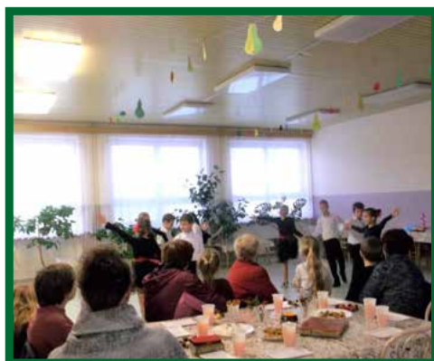
Mesiac úcty k starším - program