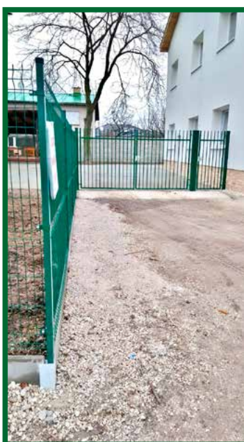
Oplotenie zberného dvora

Spolu s realizáciou zníženia energetickej náročnosti objektu obecného úradu a kultúrneho domu došlo k realizácii zberného dvora v priestore medzi objektom kultúrneho domu a oplotením futbalového ihriska. Pôvodná menšia betónová plocha bola nahradená novou, dláždenou, násobne väčšou. Došlo k výmene oplotení a vstupnej brány do areálu a taktiež k doplneniu osvetlenia. So zlepšeným zázemím sa obec bude naďalej snažiť o čo najlepšie výsledky v zbere komunálneho a triedeného odpadu. Naším spoločným cieľom je, aby nedochádzalo k tvorbe čiernych skládok v okolí obce a tým k poškodzovaniu životného prostredia. Projekt bol financovaný z fondov Európskej únie, so spoluúčasťou obce. Celkové náklady činia 502 190,58 €, pričom obec sa na projekte podieľa sumou 25 109,53 €.