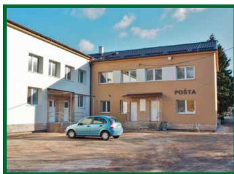
Nádvorie pri pošte

Zároveň s uvedeným sme upravili priestory požiarnej zbrojnice a pošty, ktorá je dnes výrazne kvalitnejším a moderným zariadením.