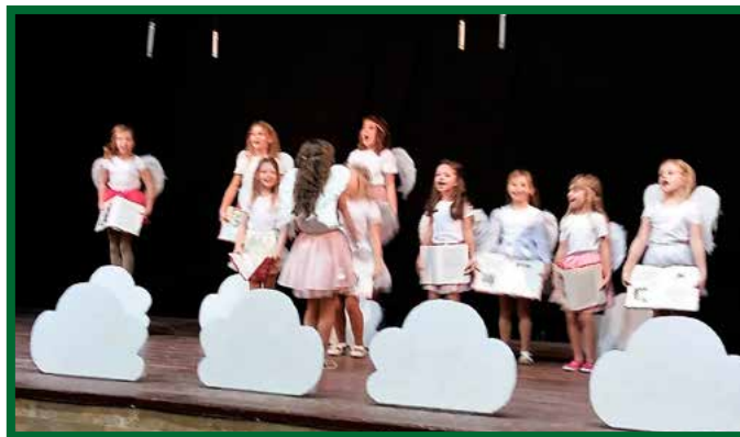
Mikuláš a program detí ZŠ a MŠ

KKVMaŠ žela všetkým občanom, aby aj v novom roku mali dôvod na zábavu a zaujímavé stretnutia. Zároveň KKVMaŠ ďakuje všetkým organizáciám v našej obci za vynikajúcu spoluprácu.