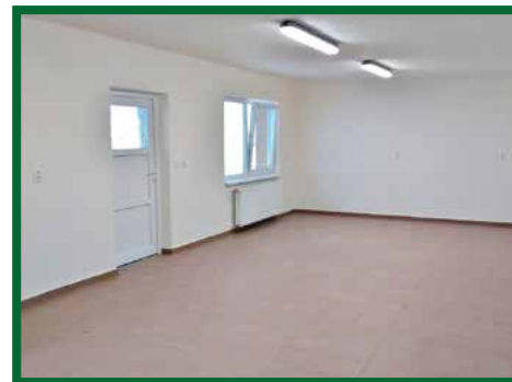
Zrekonštruované priestory pre hasičov - DHZ

Zároveň s uvedeným sme upravili priestory požiarnej zbrojnice a pošty, ktorá je dnes výrazne kvalitnejším a moderným zariadením.