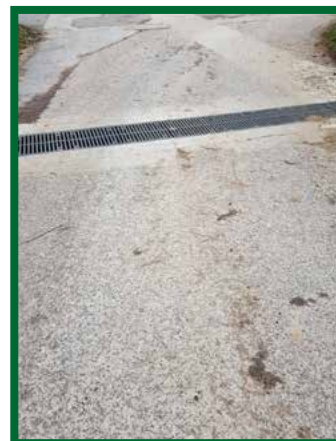
Odvodňovací žľab na miestnej komunikácii zo „Sviniarky“

Najväčšou investíciou roku 2017 je projekt zníženia energetickej náročnosti objektov obecného úradu a kultúrneho domu v obci. Cieľom projektu sú úpravy, ktoré znížia objem energií potrebný na kúrenie, chladenie či svietenie v objekte, pričom výsledkom majú byť nižšie účty za energie a tak vznikne viac možností pre obec investovať do ďalšieho rozvoja.