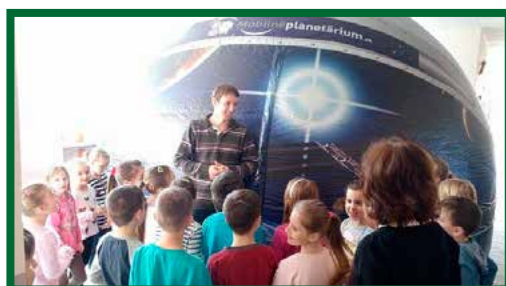
Prenosné planetárium na našej škole