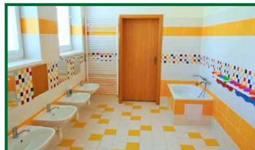
Rekonštrukcia sociálnych zariadení v MŠ na oboch poschodiach

obec investovala z vlastných zdrojov ušetrených rozumným hospodárením a to čiastku 38 942,38 €. Práca bola náročná a vyžadovala si aj trpezlivosť rodičov detí, ktorým sa chceme touto cestou poďakovať. Verím, že ich výsledok naplnil uspokojením.