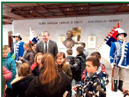
V Národnej rade SR