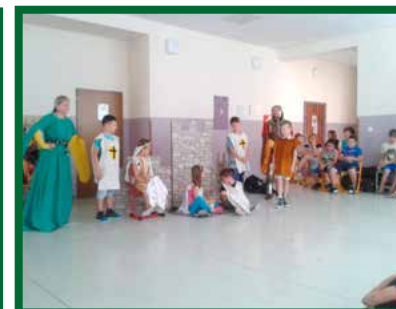
Rozprávka o rytierovi