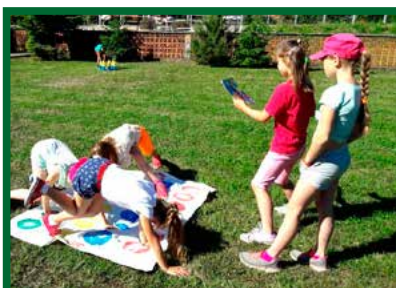
Medzinárodný deň detí