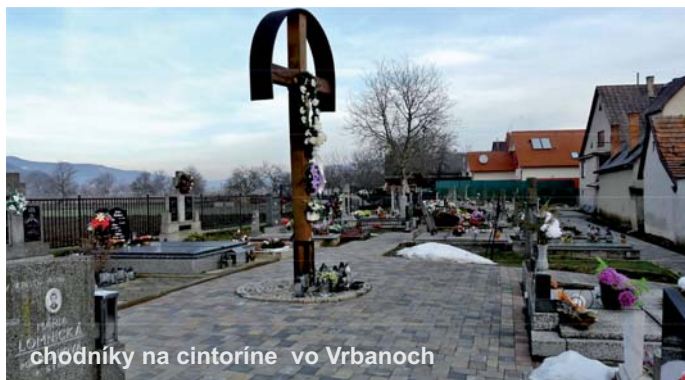
chodníky na cintoríne vo Vrbanoch