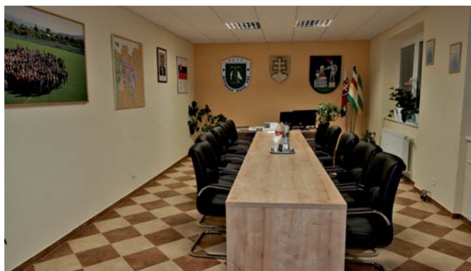
kancelária starostu obce