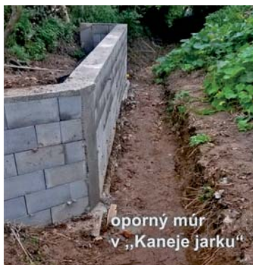
oporný múr v „Kaneje jarku“