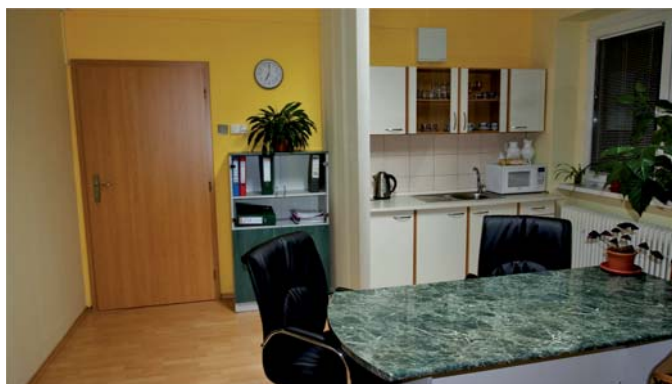
sekretariát obecného úradu