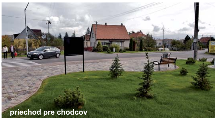
priechod pre chodcov