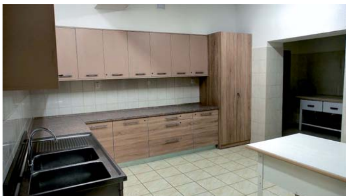
rekonštrukcia kuchyne kultúrneho domu

- obnova priestorov kultúrneho domu (kuchyňa, vestibul, priestory OcÚ):