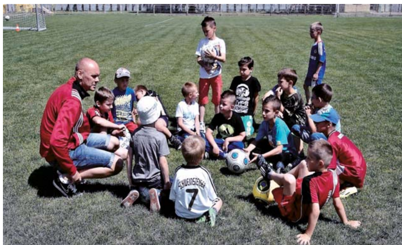
velkí malí futbalisti

TJ sa nezaobera len športovou činnosťou, ale sa aj aktívne zapája do diania v obci najmä účasťou v kultúrno-spoločenských akciách zameraných na prezentáciu obce. Našich hráčov a funkcionárov môžete vidieť ako