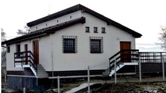
- rekonštrukcia ČOV -