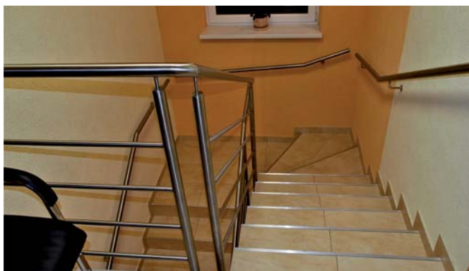
vstupné schodište obecného úradu