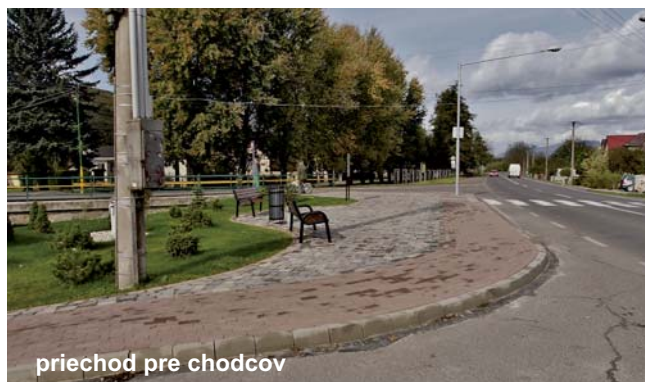
priechod pre chodcov