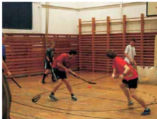
... a pri tréningu