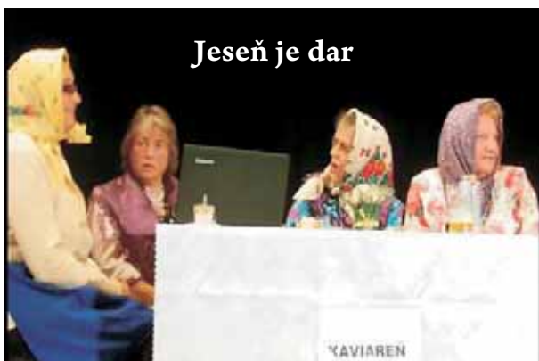
Jeseň je dar

členom našej organizácie starším ako 70 rokov a pripútaným na lôžko. „Okienko poézie“, rozšírené o prózu a piesne sa stalo obľúbeným vyplnením jedného sviatočného januárového popoludnia. KLUBOVIANKA svojim programom obohacuje úroveň týchto akcií ako aj výročnú a predvianočnú členskú schôdzu. Statočne bojujeme proti Alzheimerovej chorobe. Našou zbraňou sú rôzne kvízy, ktoré v klube často robíme. Nechceme sa uzatvárať do seba. Chceme byť užitoční aj pre našu spoločnosť. V spolupráci so Š s MŠ Diviaky nad Nitricou sme veľmi vďačne účastní pri zbierke „Liga proti rakovine“. V r. 2013 sa vyzbieralo v Diviackej Novej Vsi 318,54 €, v časti obce Vrbany 124,76 €, spolu za celú obec 443,30 €. Všetkým prispievateľom za tento ušľachtilý čin